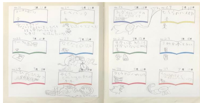
我が家の「読み聞かせノート」より

毎日、数冊、絵本の読み聞かせをした後、子どもがひとりでノートと向き合う時間を作りました。タイトルだけ書く日もあれば、絵本からイメージした絵をダイナミックに描く日、感じたことを文字で表現する日などがありました。書き終わった後、ノートを持ってきて「ママ、みてみて！あのね・・・」とおしゃべりが続く日は、膨らんだイメージと一緒に楽しみました。