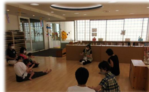
サタデーひろばの様子