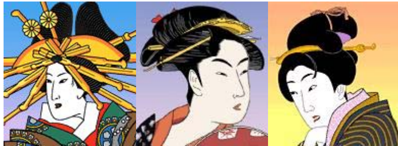
図 2 横兵庫、潰し島田、高島田 (左から順に)

なった立兵庫(横兵庫)は、左右の髷は蝶が羽を広げた形に似たスタイルになっている。その後、島田髷が一世を風靡し、後に勝山髷が大流行する。図 2 に、それぞれの髪型のイラストを示す。